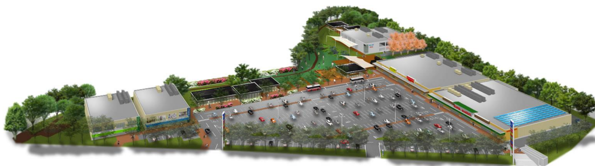
施設完成予想パース ※イメージであり実際とは異なる場合があります。

（仮称）北海道立産業共進会場跡地複合商業施設として、2019年夏オープンを予定しています。