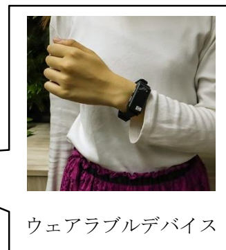
ウェアラブルデバイス